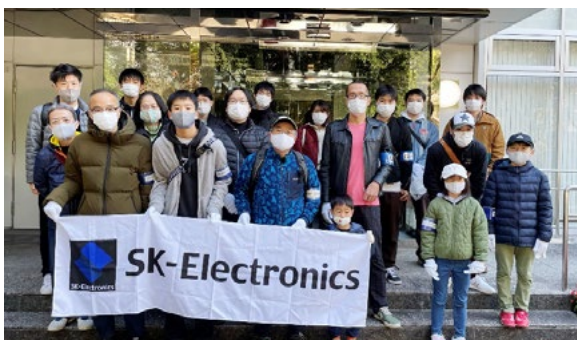
本社玄関での参加者集合写真

本社付近の地域環境活動として毎年「堀川周辺清掃活動」を実施しています。今回はコロナ禍での開催となったため、全員マスクをしておの参加となりましたが、社員とご家族を含め、20人の参加者が集まりました。清掃活動では2班に分かれ、本社ビルから水火天満宮を目指すチームと丸太町通りを目指すチームに分かれ、堀川通り沿いの清掃を行いました。人通りは例年より少なかった印象ですが、商店街沿いの茂みの中には相変わらず多くのゴミがありました。また、河川敷ではマスクのゴミなどが流れ着いており、新型コロナウイルス感染症の流行の影響がこんなところにも感じられました。1時間程度の清掃時間で回収できたゴミの量は20kgにも及びました。今後も、清掃活動を通じて地域の方々との交流を深め、環境啓蒙を図っていきたくと考えています。