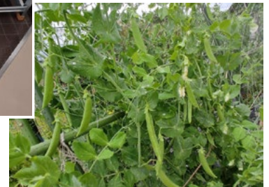
実ったスナップエンドウ