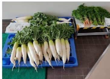
収穫した大根と人参

滋賀工場では7年前より、社内環境活動の一環として、滋賀工場の敷地内の畑で野菜を育てています。今年は異例の長雨など自然環境の変化を感じながらも、大根、スナップエンドウ、ニンジンなど計9種の野菜を収穫することができました。新型コロナウイルスの影響もあり、今年の収穫祭も中止となりましたが、収穫物は社員が持ち帰り、自然の恵みをいただきました。