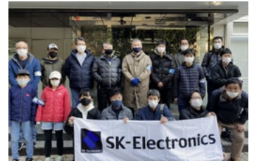
本社玄関での参加者集合写真

本社付近の地域環境活動として毎年「堀川周辺清掃活動」を実施しています。今年もコロナ禍での開催となったため、全員マスクをしておこなった参加となりましたが、社員とそのご家族を含め18人の参加者が集まりました。清掃活動は本社ビルから扇町公園を目指すチームと丸太町通りを目指すチームの2班に分かれ、堀川通り沿いの清掃を行いました。昨年に比べ人通りが少し戻ったようで、空き缶やペットボトルなどのポイ捨てが目立ちました。1時間程度の清掃時間で回収できたゴミの量は20kgにも及びました。今後も清掃活動を通して地域の方々との交流し、環境啓蒙を図っていきたくと考えています。