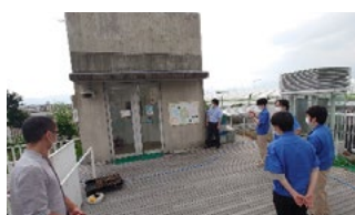
屋上ビオトープの見学

また、体験型の意識啓蒙のアイデアとして「緑とのふれあい」についてご提案いただき、今後の活動の参考にしていきたいと思えます。見学の様子は「環境社内報「SKEECO」」で全社員に紹介し、環境意識の向上を図っています。